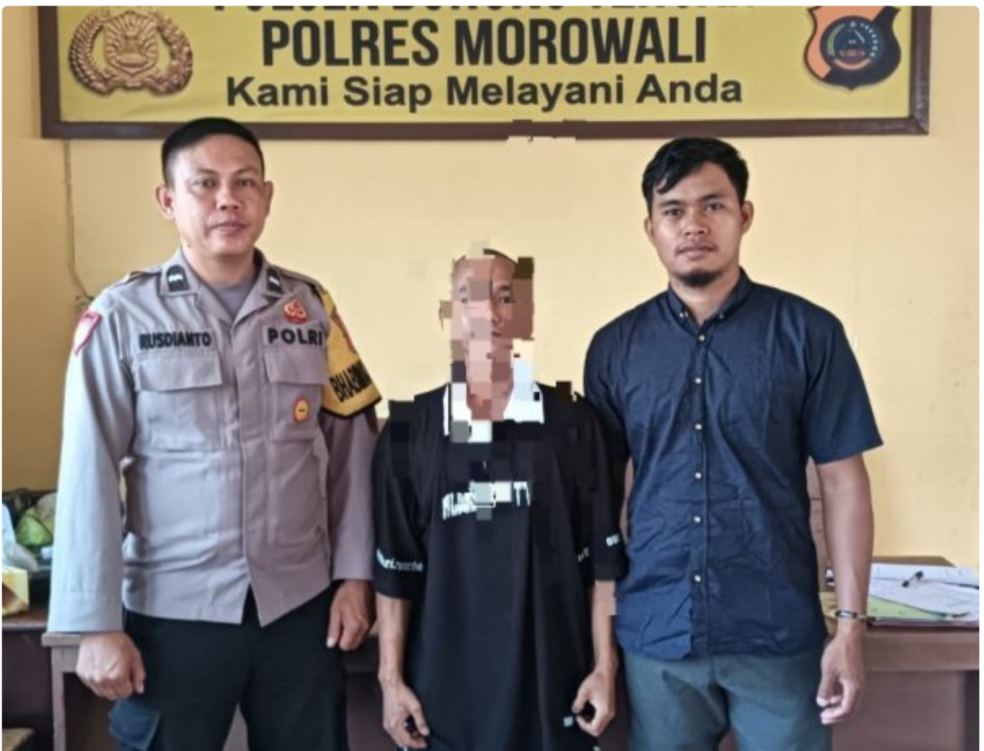
Aparat Polsek Bungku Tengah Berhasil Tangkap Pelaku Curanmor

MOROWALI, Sulawesi Tengah- Pada Hari Sabtu 5 Oktober 2024 Sekitar Pukul 18.30 Wita Kepolisian Sektor (Polsek) Bungku Tengah Polres Morowali, berhasil mengungkap kasus pencurian kendaraan bermotor (curanmor) yang terjadi di