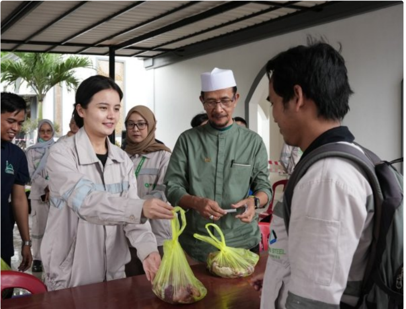
Karyawan non muslim di PT IMIP panitia kurban